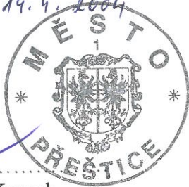
Mgr. Antonín Kmoch starosta města Přeštice